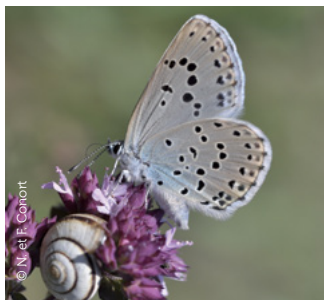
Azuré du Serpolet