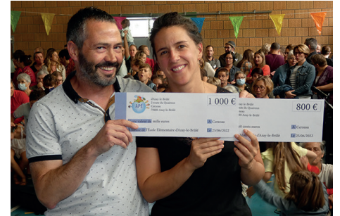
Fête des écoles