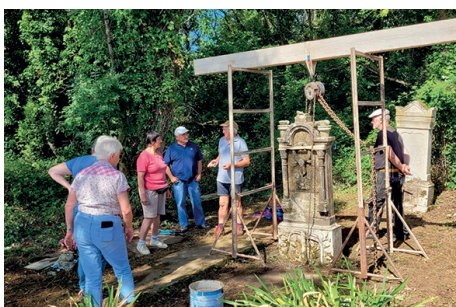
Pose de la stèle du poilu