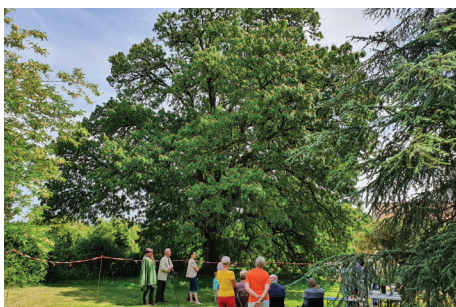
Cormier de Chamier