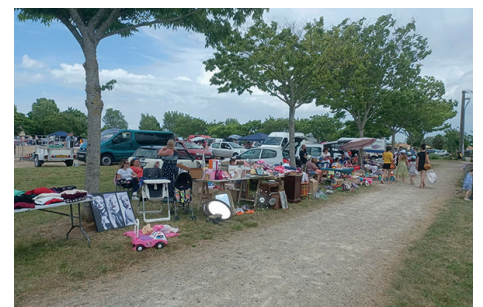
Vide grenier de l'APE