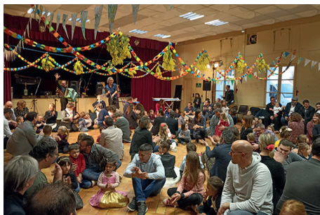
Bal de l'école maternelle