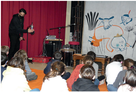
PARCO à l'école élémentaire