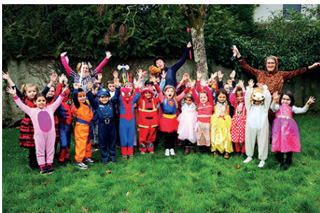
Carnaval de l'école maternelle