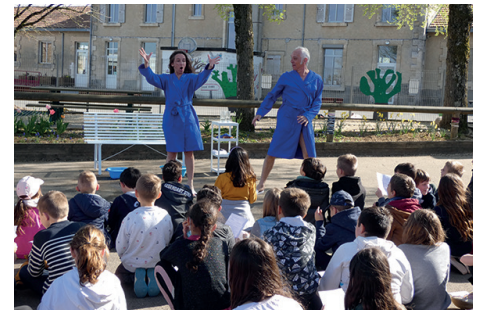
« Grande lessive »