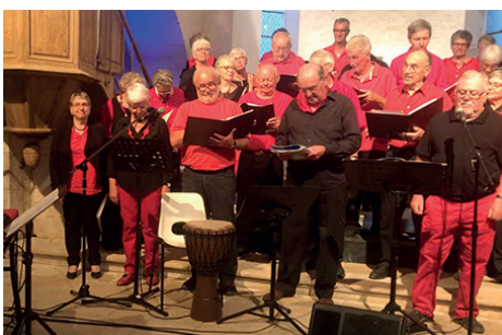
Concert du Chœur y'en a marre