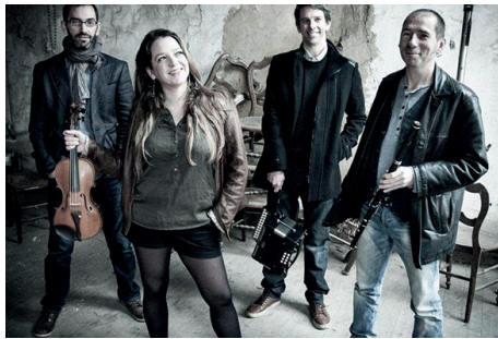
Saint-Patrick avec ZONK