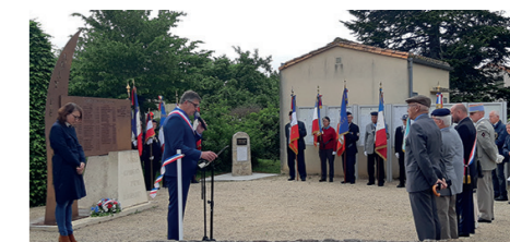
Commémoration du 13 mai