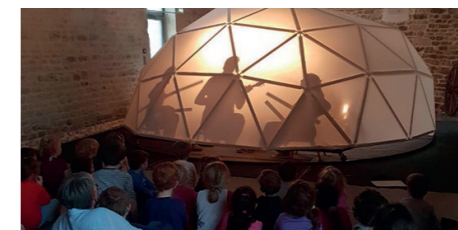
Sortie de résidence «Toundra»