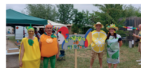
Rallye de la SEP