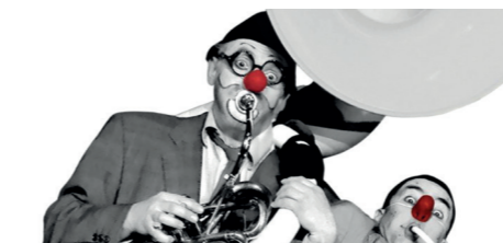
Trottino Clowns - Paf d'ans l'pif !