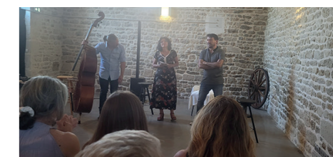
Seconde lecture d'Entre 2 Vers