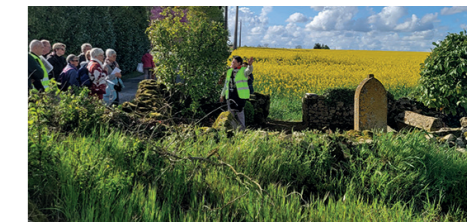
Carnets d'Azay à Mons