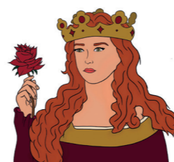
Théâtre Aliénor d'Aquitaine