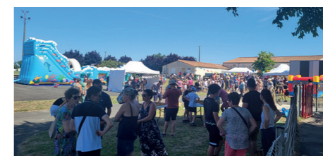
Fête des écoles