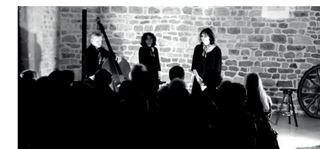
Lecture d'Entre deux Vers