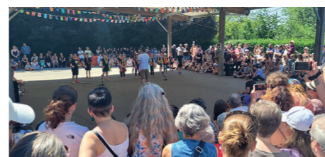
Fête des écoles