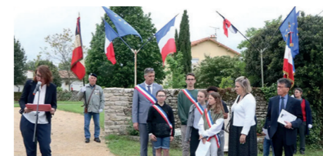
Commémoration du 8 mai