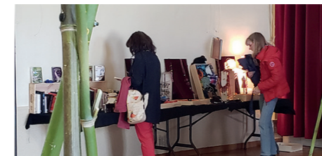
Troc'Madame et Troc'Monsieur